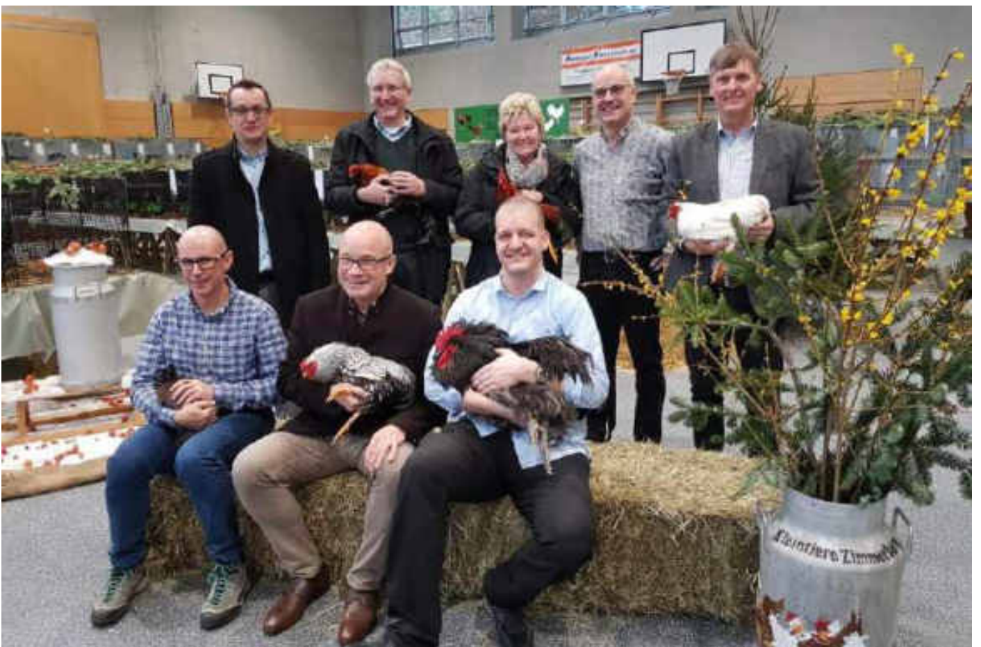
Eröffnung in Adliswil mit Statthalter, Stadtrat, Gemeinderat, Organisationskomitee, Pfarrer etc.