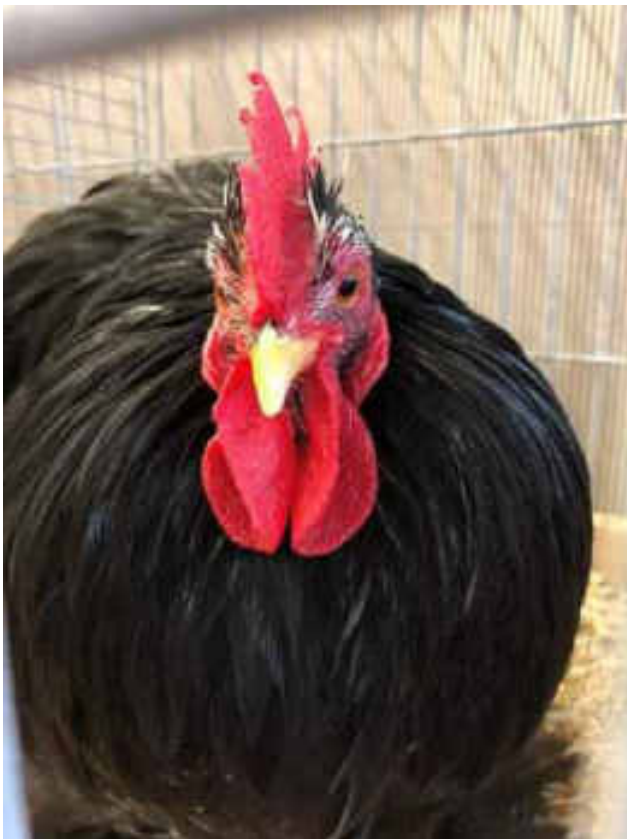
„Zu grosse Kehllappen und erst noch offen, hat der Richter gesagt, meine Hennen stört's nicht.“