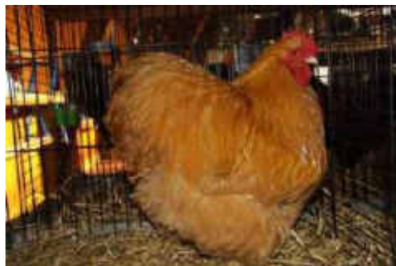
1.0 Orpington 97 P. Züchter: ZG Raymann / Rast

Allen Züchterinnen und Züchtern, den Sektions- und Verbands-Vorständen, speziell den Geflügel-Obmännern und -frauen, danke ich für die gute und kollegiale Zusammenarbeit. Dem Gesamtvorstand von Kleintiere Zürich und der Abteilungskommission danke ich ebenfalls für die kameradschaftliche Zusammenarbeit.