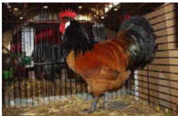
1.0 Vorwerk 95 P. Züchter: Ueli Ehrismann