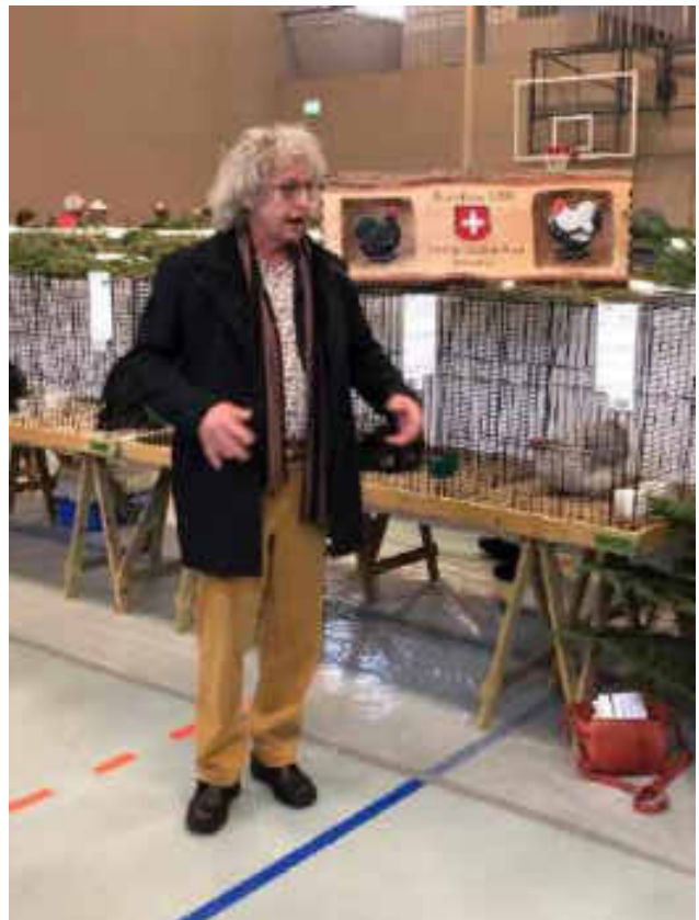
Tierbesprechungen anlässlich von Ausstellungen sind lehrreich und sinnvoll.