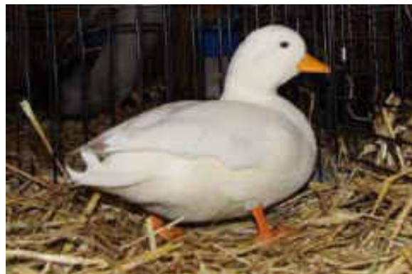
1.0 Zwergente 96 P. Züchter: Beat Schoch