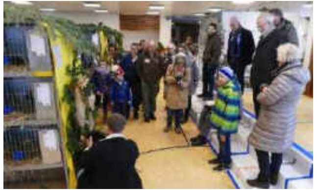
Verbandsausstellung Hombrechtikon

Die kantonale Rammlerschau, die an dieser Ausstellung angeschlossen werden konnte, wurde mit 84 Tieren besetzt.