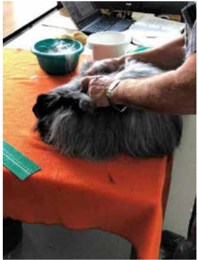
Die „reife“ Wolle kann einfach gelöst werden.