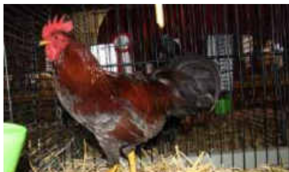
1.0 Zwerg-Welsumer 96 P. Züchter: Gion Gross

Im Frühjahr fanden einige Jungtierschauen statt. Es ist immer wieder schön zu sehen, mit wie viel Hingabe die einzelnen Sektionen ihre Jungtierschauen präsentieren. Dies ist ein wichtiges Schaufenster für die Kleintierzucht gegenüber der Bevölkerung.