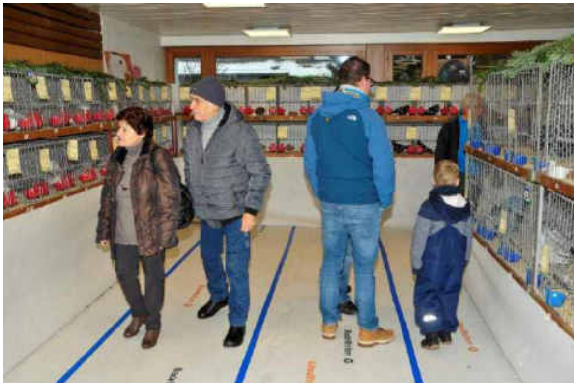
Kantonale Taubenausstellung in Hombrechtikon