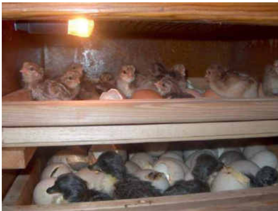
Schlupf im Brutapparat - oben Hühner unten Enten