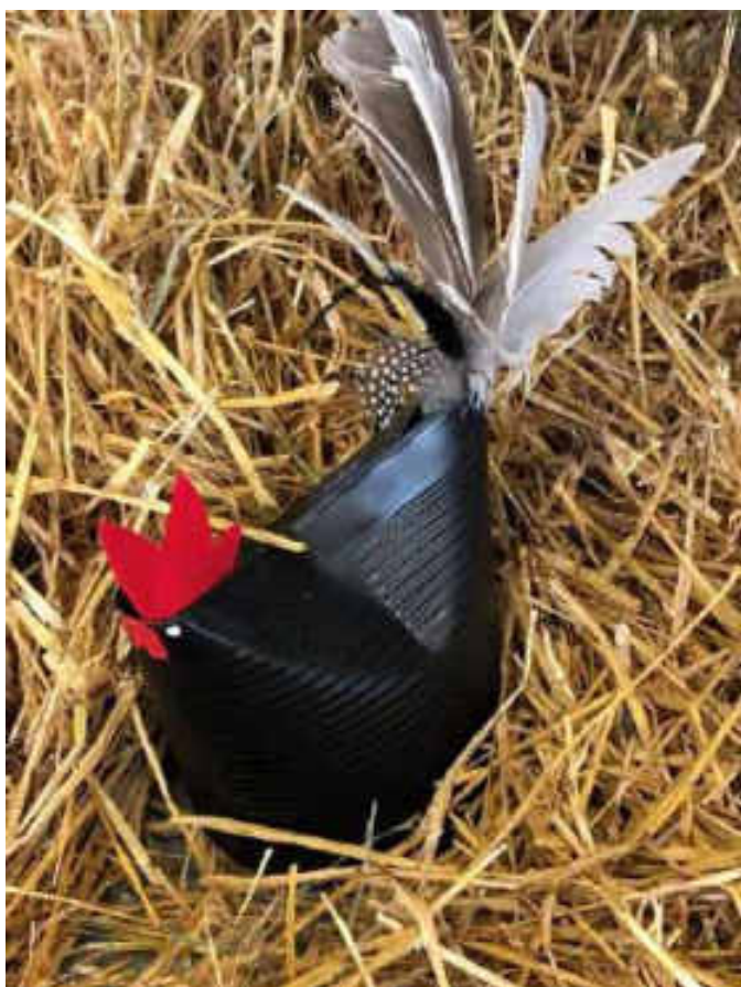
Impressionen Ausstellung Kollbrunn