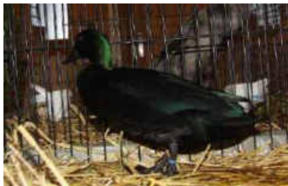
1.0 Smaragte 97 P. Züchter: Fam. Zollinger

In diesem Jahr fanden die vier Verbandsausstellungen an zwei Wochenenden statt, so dass man alle Ausstellungen besuchen konnte. Es war erstaunlich, mit wieviel Freude und Umsicht die einzelnen Ausstellungen organisiert wurden.